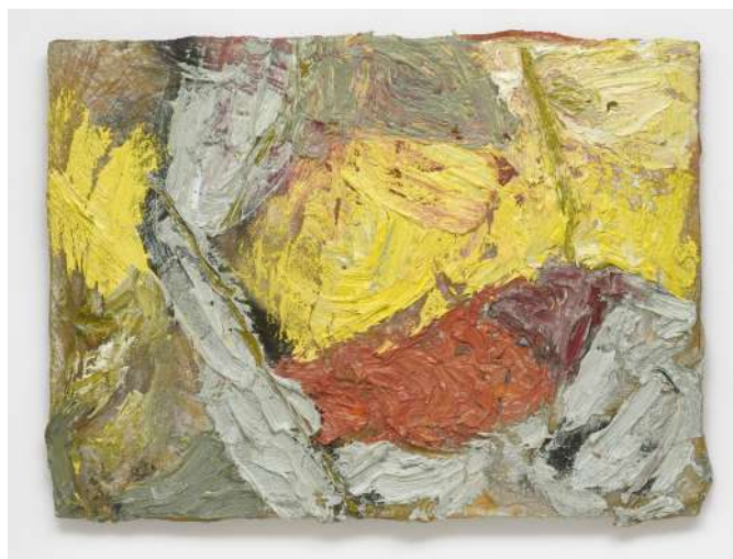
untitled (yellow grey), 2025