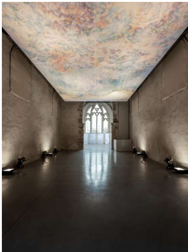
Hubble bubble , Acrylique et pigments sur toile, 700 x 1200 cm, exposition La mer de la tranquillité , Centre d'art Les Églises Chelles, 2021, © Origins studio,