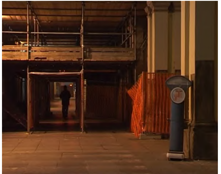
La nuit sans étoiles, 18mn, 2006.