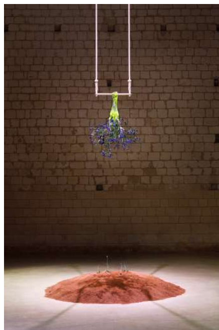
Se raccrocher aux branches, Pâte de verre verre, verre filé, trapèze, 2024.