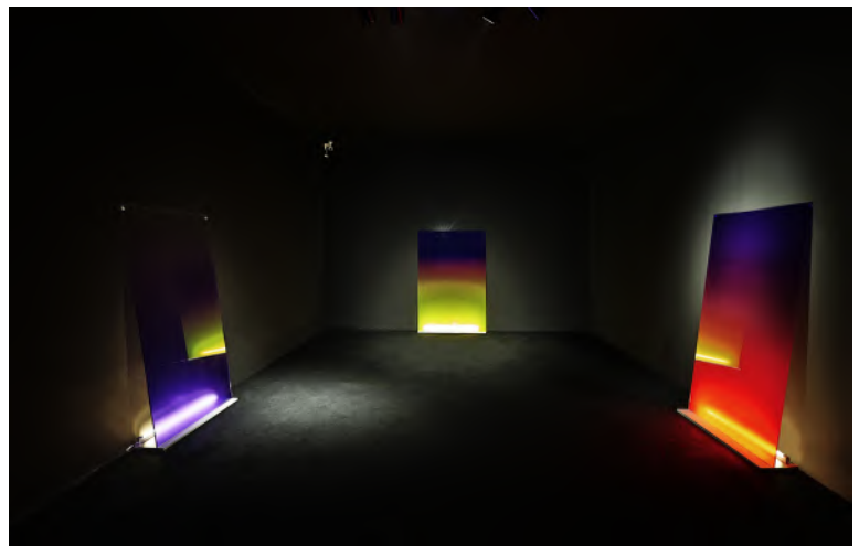
Light-Under-Skin-2023-Biennale Suzhou, Chine