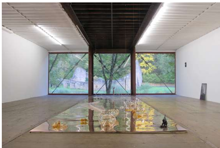
2023