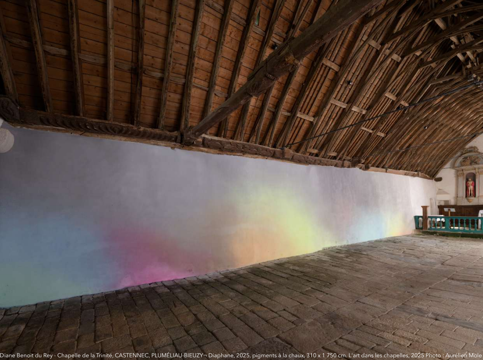
Diane Benoit du Rey - Chapelle de la Trinité, CASTENNEC, PLUMÉLIAU-BIEUZY - Diaphane, 2025, pigments à la chaux, 310 x 1 750 cm. L'art dans les chapelles, 2025