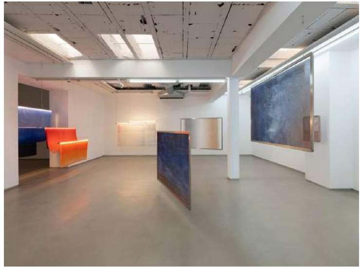
My shadows is yours, vue exposition Parra & Romero, Madrid, 2025.