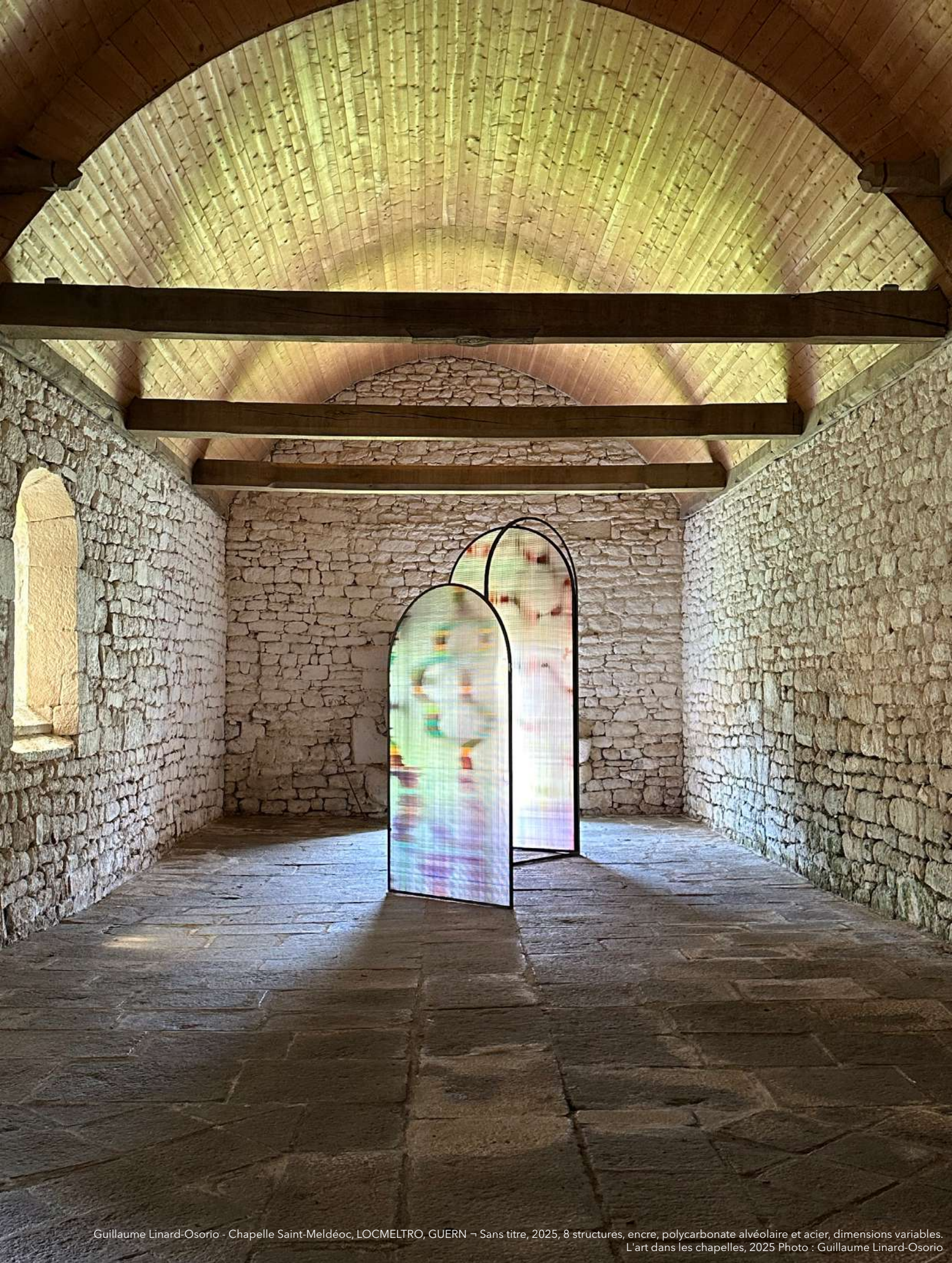
Guillaume Linard-Osorio - Chapelle Saint-Meldéoc, LOCMELTRO, GUERN - Sans titre, 2025, 8 structures, encre, polycarbonate alvéolaire et acier, dimensions variables. L'art dans les chapelles, 2025