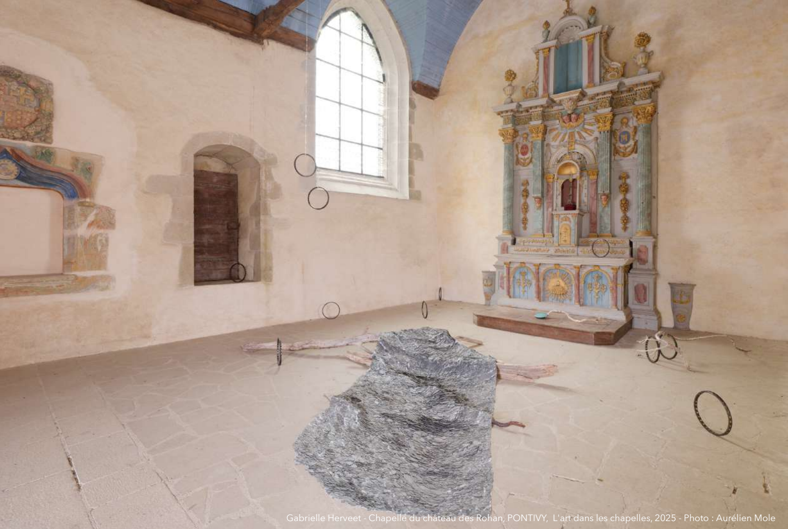
Gabrielle Herveet - Chapelle du château des Rohan, PONTIVY, L'art dans les chapelles, 2025