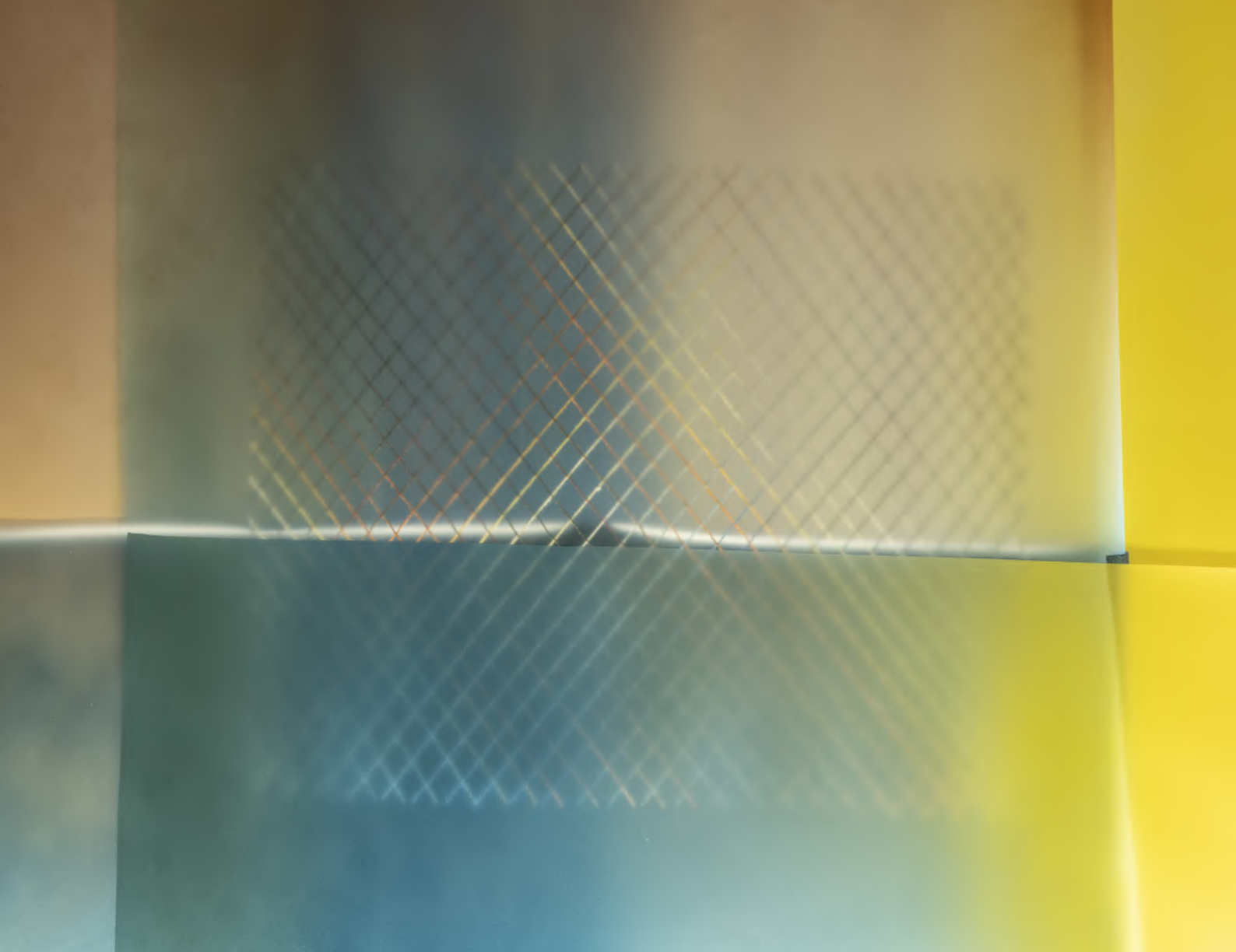
Luisa Jacinto, detail from Strangers IV, 2024. Synthetic rubber, polyester thread and resin, LED tube, electrical cables, and stainless steel cables; 107.5 × 150 × 3 cm