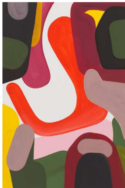
8549, 120 x 80, 2024