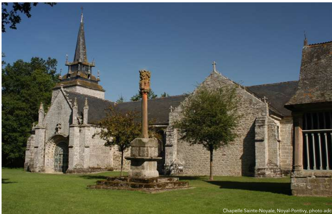
Chapelle Sainte-Noyale, Noyal-Pontivy

L'art dans les chapelles est le fruit de l'association des communes de Pluméliau-Bieuzy (commune fondatrice), Guern, Le Sourn, Malguénac, Melrand, Evellys (Moustoir-Remungol), Noyal-Pontivy, Pontivy, Quistinic, Saint-Barthélemy, Saint-Thuriau. Elle est aussi partenaire du Diocèse de Vannes et des paroisses de Bubry, Guern, Noyal-Pontivy, Baud, Pluméliau-Bieuzy et Pontivy.